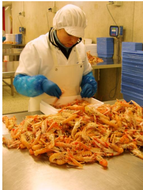
Ireland du Nord