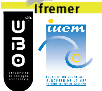
Réunion de l'UMR-AMURE Ifremer, Brest, 2010